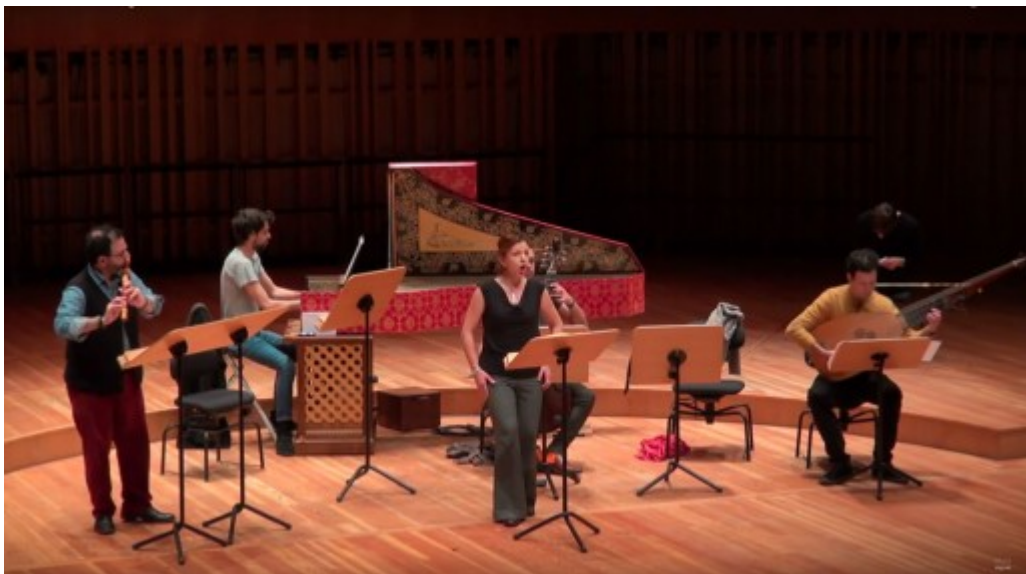
Sagittarius, capture écran d'une vidéo visible ci-dessous (Station Ausone)